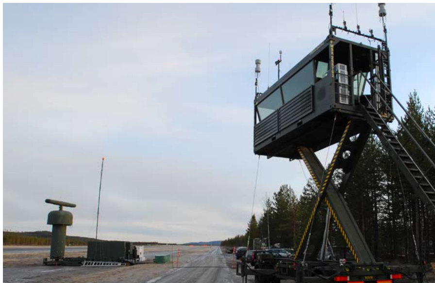
En del i Komnätet är flygledartornet på en saxlift.