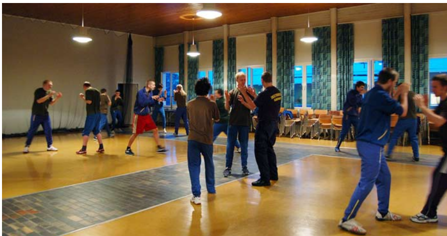
Ända in i slutet av värnplikten utbildades soldaterna.