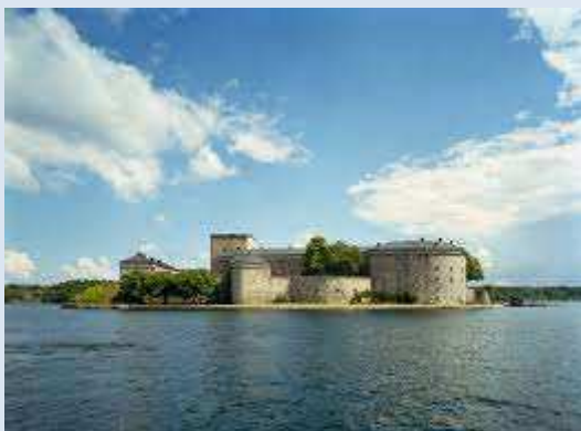
Vaxholms fästning där det en gång började

D en första ännu verksamma militära kamratföreningen i Sverige bildades i december 1899. Det var Kamratföreningen Vapenbröderna knuten till Vaxholms artillerikår. Som ett litet kuriosum kan nämnas att vapenslaget kustartilleriet bildades först tre år senare 1902. Då blev benämningen KA 1, Vaxholms kustartilleriregemente. Det dröjde ända till första världskrigets utbrott 1914 innan nästa kamratförening, Älvsborgs krigareförening, som den ursprungligen hette, såg dagens ljus. Däremot var det inte andra världskriget som innebar starten för huvuddelen av dagens kamratföreningar. Dessa bildades efter hand åren 1925 till 1939 under intryck av nedrustningen fram till 1936. Det sades ju som bekant efter första världskriget att det inte skulle bli något mer världskrig.