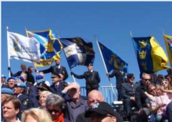
SMKR fana flankerad av Lapplands Jägare och Flottans Män under Veterandagen.

SMKR är en del av de fem ideella organisationer Sveriges Veteranförbund Fredsbaskrarna (SVF), Svenska Soldathemsförbundet (SSHF), Invidzonen (IZ) och Idrottsveteranerna (IV) som, på uppdrag av Försvarsmakten, stödjer utlandsveteraner och deras anhöriga på olika sätt.