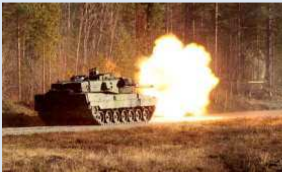
Kamrater i Armén.

sig i förbandens ceremoniella verksamhet, t.ex. försvarsdagar.