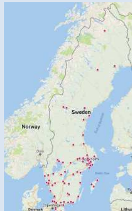
Karta över Kamratföreningarnas spridning

dag finns kamratföreningsrörelsen spridd över hela landet, från Kiruna i norr till Ystad i söder.