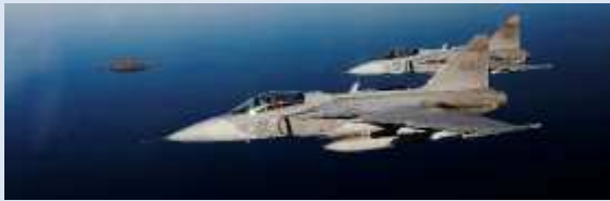
Kamrater i Flygvapnet.

av en eventuell riksorganisation. Även om kamratföreningsrörelsen var opolitisk ville man dock kunna göra sin stämma hörd. Framför allt ville man kunna deltaga i olika manifestationer som t.ex. Svenska Flaggans Dag och den särskilda årliga vårparaden i Stockholm som inleddes 1939. Ett förslag presenterades redan 1934. Det kom från Fälttelegrafisternas kamratförening, nu Signaltruppernas kamratförening, där man föreslog ett centralråd. Det vann emellertid inte odelat gillande och verksamheten fortsatte att baseras på frivillig samverkan från fall till fall.