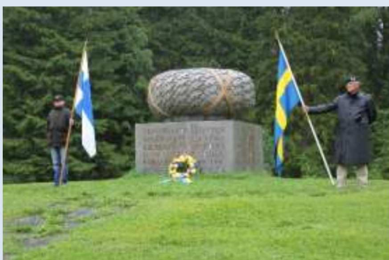
Kamrater från de nordiska länderna hedrar offer från VK II

SMKR har tecknat en överenskommelse med Försvarsmakten som bland annat innefattar ovanstående delar. Här har kamratföreningarna i landet en stor och viktig uppgift att fylla.