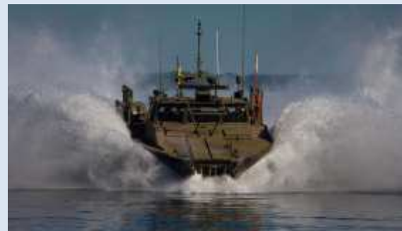
Kamrater i Marinen.

sin verksamhet efter 1927, bildades av befäl och/eller värnpliktiga vid de regementen som drogs in med 1925 års försvarsbeslut. Några av dessa är alltså verksamma, t.ex. Föreningen Smålands husarer. Men även vid många av de regementen som levde vidare, skapades kamratföreningar. Den största kamratföreningen då liksom nu är den 1935 instiftade Flottans Män, som tillika är vår enda vapenslagsförening, och även ett riksförbund inom riksförbundet SMKR.