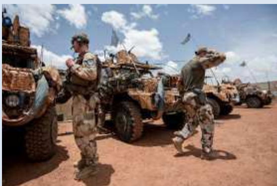
Kamrater i utlandsmission.

I de flesta förening finns kamrater – officerare och civilanställda – som tjänstgjort och alltjämt tjänstgör nationellt och i vissa fall internationellt inom försvarsmakten. Många föreningar erbjuder även tidigare värnpliktiga möjlighet till medlemskap. På senare år har dörren öppnats för medlemskap till personer som står utanför Försvarsmakten, men som har ett intresse för försvaret och som, på olika sätt, önskar stödja förbandets kamratförening. Detta oaktat om förbandet alltjämt är verksamt eller är nedlagt.