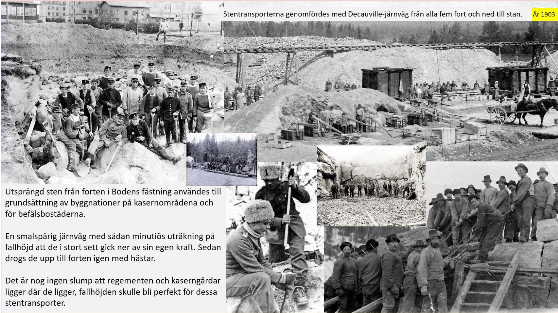
De som byggde Bodens fästning 1901-1908

Utsprängd sten från fortet i Bodens fästning användes till grundsättning av byggnationer på kasernområdena och för befälsbostäderna.