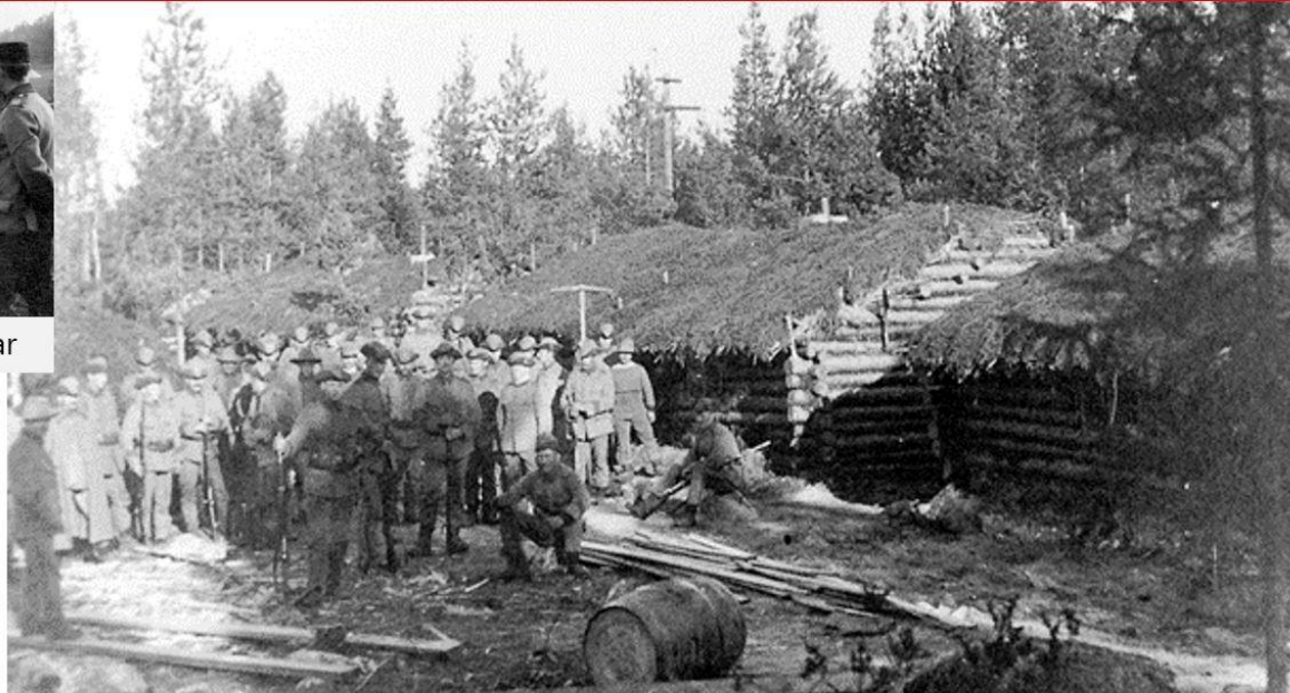
Lite lyxigare fick befälen bo i kring bergsforten.