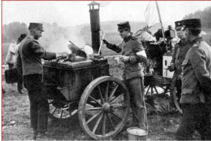
Maten kokades i dessa trossar