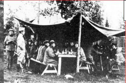
Utspisning i fält år 1915

De som var inkallade under första världskriget låg förlagda i anslutning till bergsforten i de timrade stugor som växte upp i skogarna runt om.